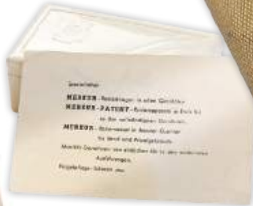
Dietrich Hermes' business card from the 1950s